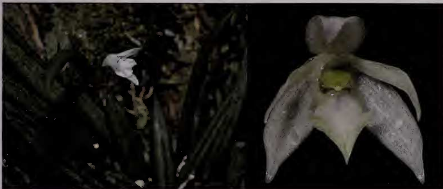
Fig. 2 : Leptotes beatricis

Habitat : épiphyte en forêt très humide. Petite population d'individus épars.